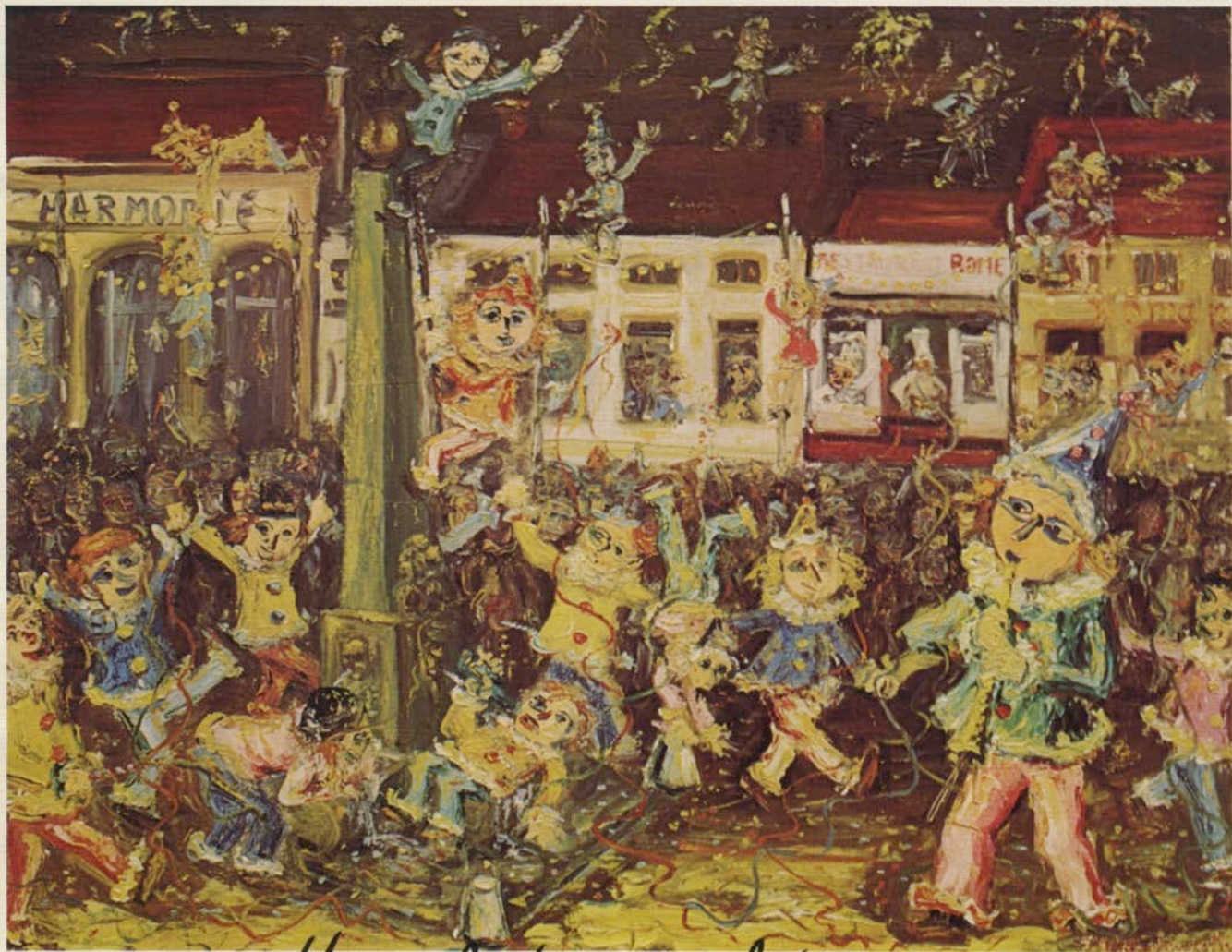
Manifeste du folk-art.