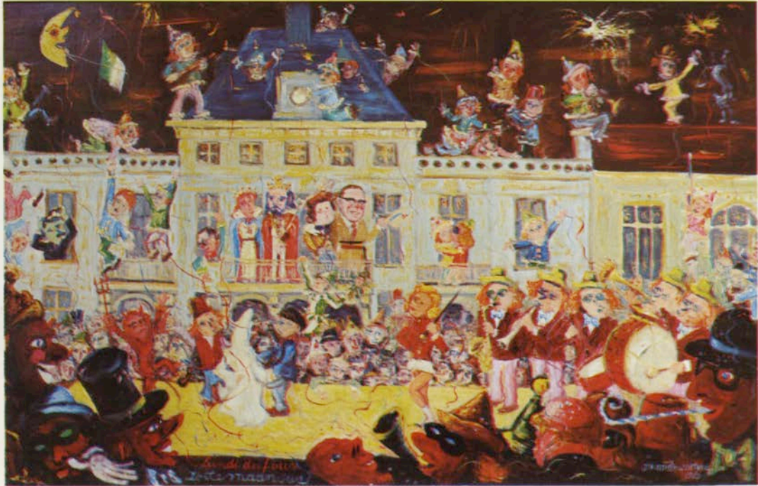
Renaix: Lundi des Fous.