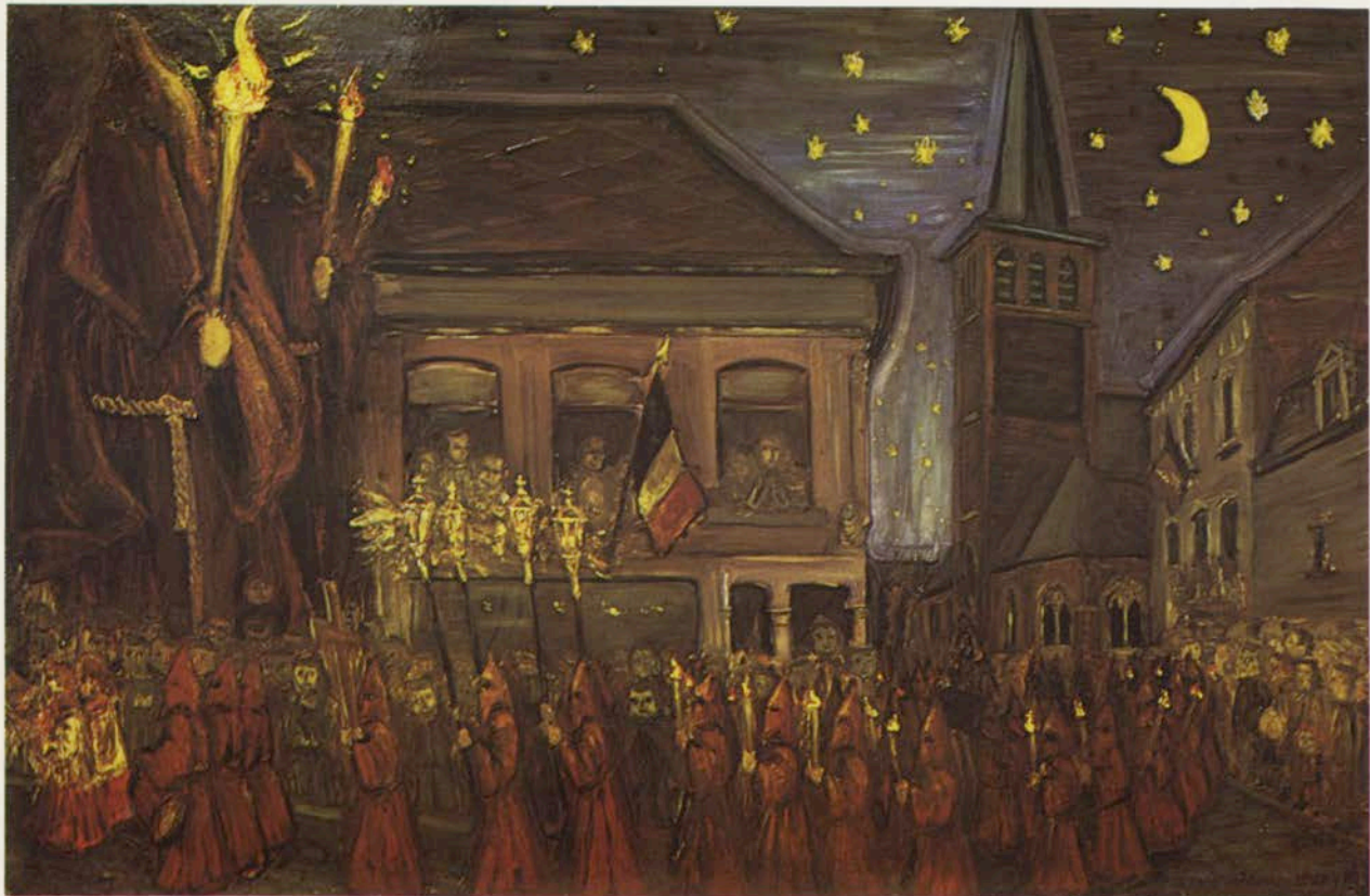
Lessines · procession du Vendredi-Saint