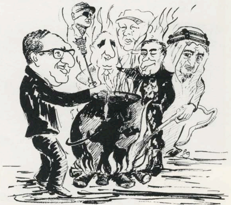
En preparation: Des Histoires de Churchill